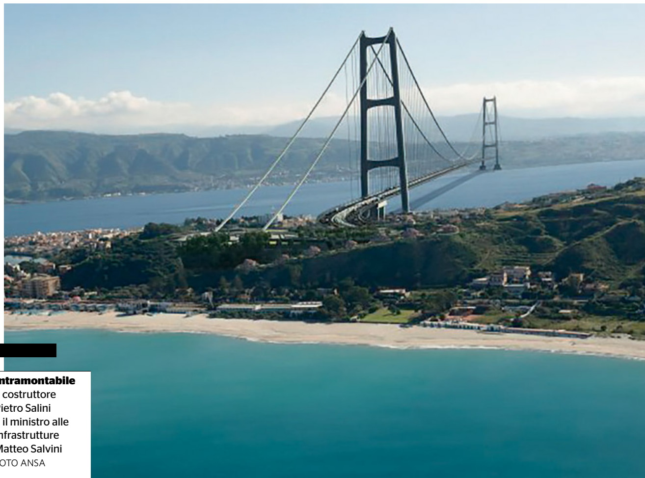
Intramontabile Il costruttore Pietro Salini e il ministro alle Infrastrutture Matteo Salvini

L'intesa, a questo punto, potrebbe prevedere la rinuncia da parte di