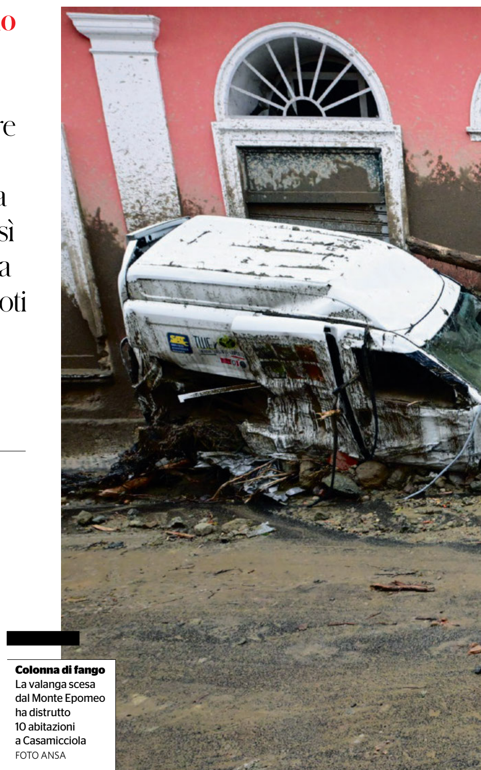
Colonna di fango La valanga scesa dal Monte Epomeo ha distrutto 10 abitazioni a Casamicciola

Ma guai ad additare Ischia come la capitale degli abusi: politica e popolazione locale si inalberano come un tutt'uno. Il 21 agosto 2017 una scossa di terremoto di modeste dimen-